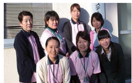
美祢市訪問看護ステーション職員

現在、高齢化が進む中で病院や施設の利用、介護を必要とする人が増えています。少しでも多くの地域のみなさんがすみ慣れたご自宅で安心して過ごせるために私たちは病院や施設、ケアマネージャー、ヘルパー、訪問入浴など様々な機関と協力をして今後も在宅の生活をお手伝いしていきます。ご利用をお待ちしています。